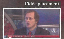
présentée par Laurent Saillard