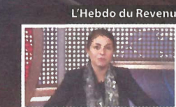
présentée par Marianne Py