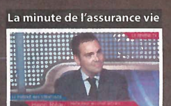
présentée par Henri Réau