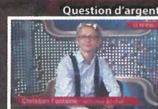
présentée par Christian Fontaine

Chaque semaine, la rédaction du Revenu interroge pour vous les dirigeants d'entreprise, les décideurs et les analystes qui font l'actualité